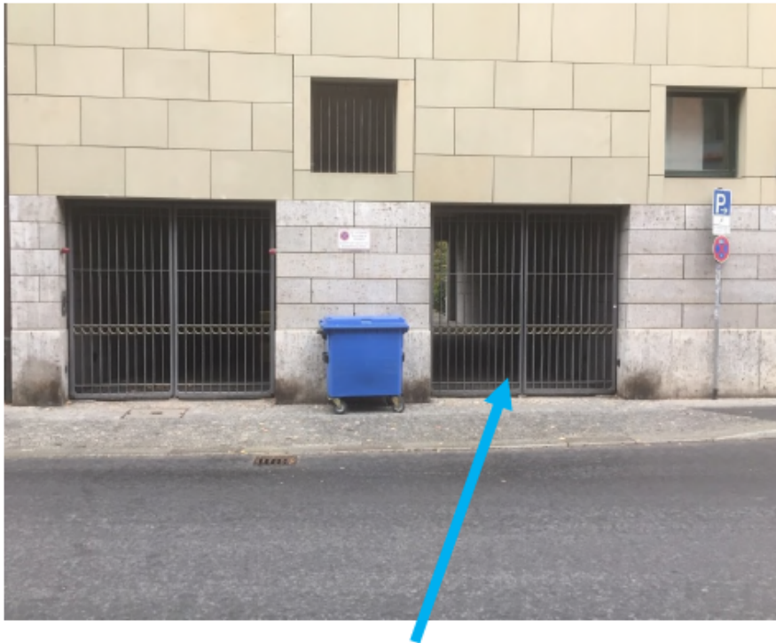
Anlieferungszone = Durchfahrt (für den Containertausch)